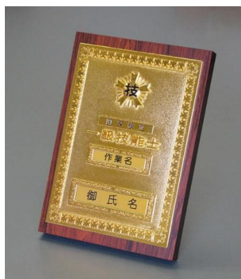
⑨1級机上用 ¥20,900 ダイカスト仕上(24KGP) (縦24cm 横16.5cm 厚さ2cm)