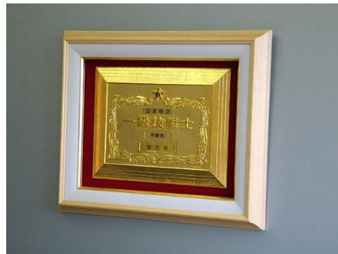
②1級楯ガラス額入り ¥41,800 ガラス額外木枠・別珍張り (縦44cm 横53cm 厚さ5cm)