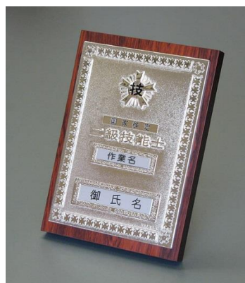
⑩2級机上用 ¥19,800 ダイカスト仕上(純銀メッキ) (縦24cm 横16.5cm 厚さ2cm)