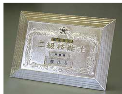
⑧2級店頭用楯 ¥24,750 ダイカスト仕上(純銀メッキ) (縦27cm 横35cm 厚さ1.5cm)