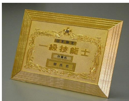
⑥1級店頭用楯 ¥27,500 ダイカスト仕上(24KGP) (縦27cm 横35cm 厚さ1.5cm)