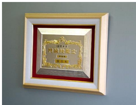
①特級楯ガラス額入り ¥44,550 ガラス額外木枠・別珍張り (縦44cm 横53cm 厚さ5cm)